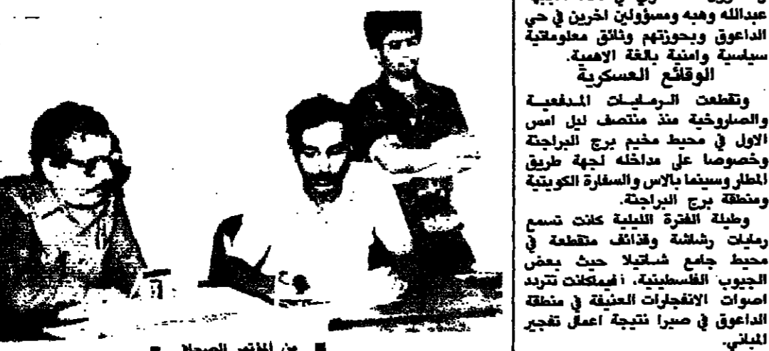
من المناصر الصلبي

عقدت جبهة الانقاذ الفلسطينية مؤتمرا صحفيا في المجلس السياسي للحركة الوطنية في وطني المصيرية بعد ظهر امس، اعلنت فيه ان خلافا قريبا سيطر لا يمكن ان يؤدي الى هذه الحملة البربرية، لولم يكن مسيرنا بحملة شاملة من التوعية والتدريب ضد الفلسطينيين بوجه عام. لكننا في جبهة الانقاذ كنا نتعامل عن هذه الاعمال ونحضر على الجرحى ونؤذيهم القتل والمعاملة جرمنا الشديد على التحلف مع الجبهة الوطنية الديمقراطية وحركة امل، وكنا نعمل يدبا على تعزيز هذا التحلف من اجل تصليب الحلف الاساسي الذي حقق الانتصارات على جيش العدو الصهيوني وقوات حلف الاطلسي. حريصون على التخلص الشلالي الفلسطيني - السوري الرطبي اللبناني. ولم نستطع التصديق الهلثة والبوليمية البنية ان تحمي حملة الابرة لتسليما وجرف الديون والاختراقات المواصلية لوقف الاطلاق النار في الفتح وشعبنا وبغير ان الهدف والنتيجة. ان قوات امل، واللاوانين، و٥٩٦ قتيلا واستغلال حملة السلام بعد الانسحاب لثمن الاخطار لتصل مسلح الحجاز والابامة والتضحية لتبنيها. لكننا نطالب بوقف العمليات العسكرية وسحب المسلحين من حول المخيمات لورا وانحل الهبات القسعة والاشتماء لاجلاء الجرحى. لقد جرت اليوم (امس) محاولات (البقية على الصفحة ١٢)